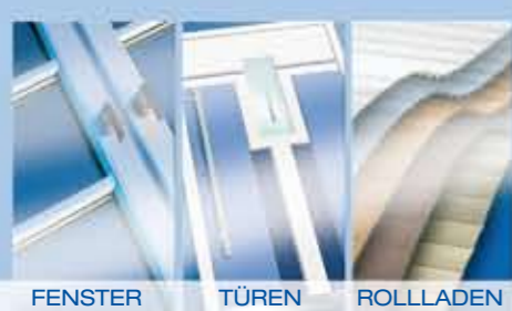
FENSTER TÜREN ROLLADEN

Brömse GmbH & Co. KG J.-G.-Nathusius-Straße 23 39340 Haldensleben