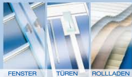
FENSTER TÜREN ROLLADEN

Brömse GmbH & Co. KG J.-G.-Nathusius-Straße 23 39340 Haldensleben